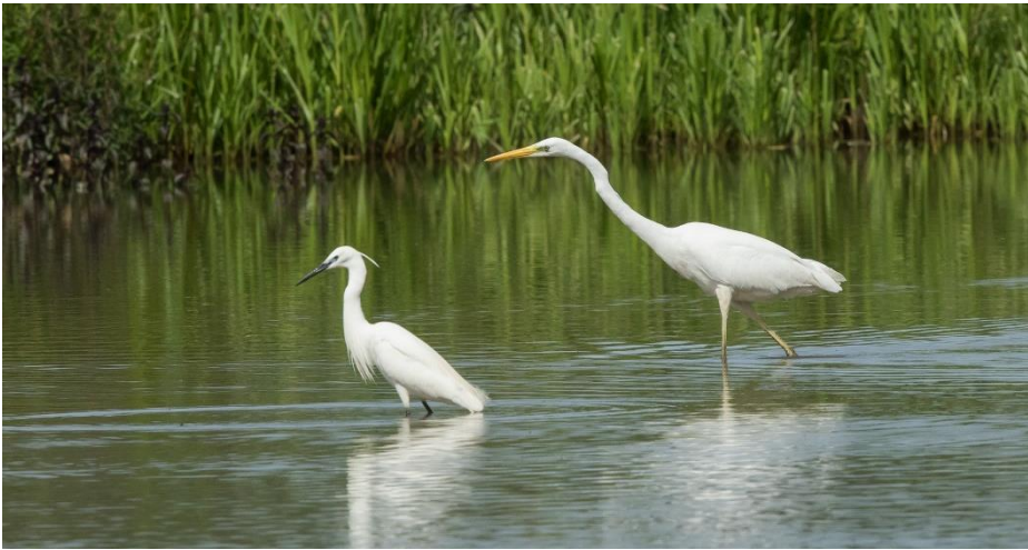
Silberreiher & Seidenreiher