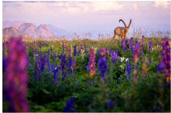
Nicole Watkins Schöne Schweiz

Entdecke die Schweizer Artenvielfalt und lasse dich in unsere heimische Natur entführen. Die Natur vor unserer Haustüre birgt viele Überraschungen: von kämpfenden Raufusshühnern bis zum König der Alpen nehme ich dich auf eine Reise durch die Schweizer Wildnis.